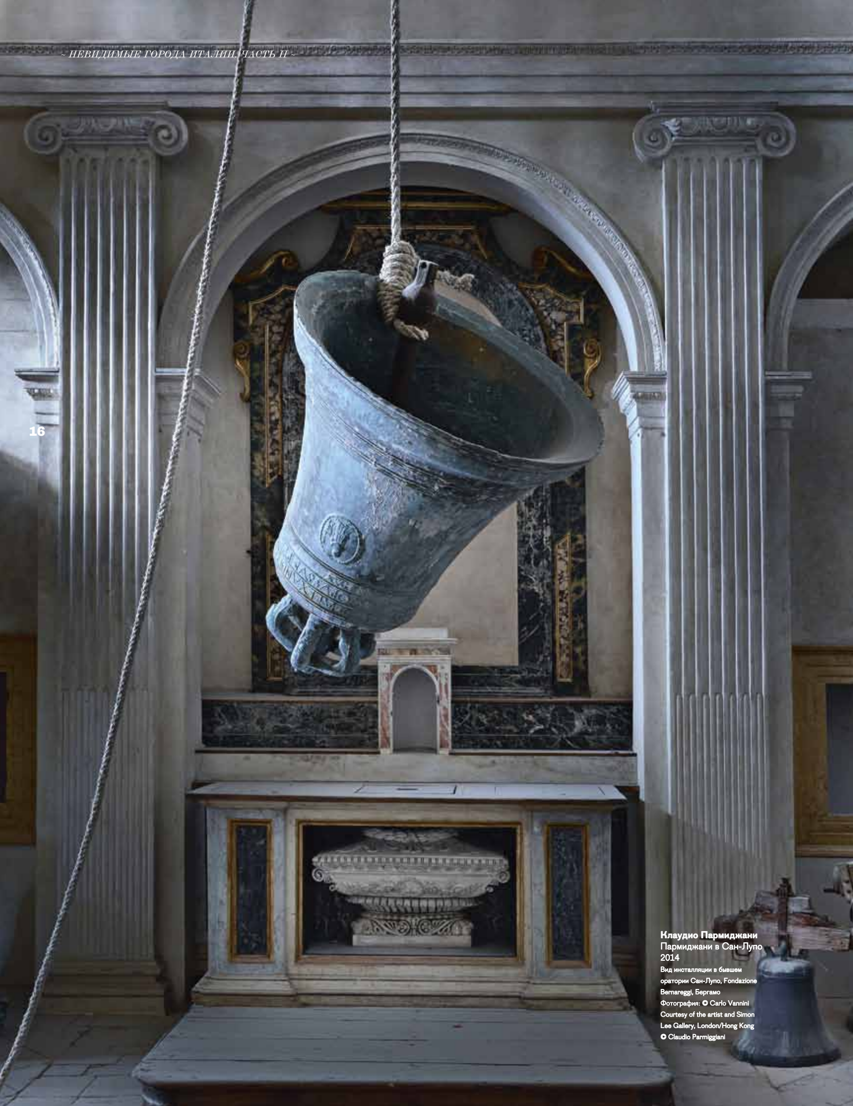
Клаудио Пармиджани Пармиджани в Сан-Луло 2014 Вид инсталляции в бывшем оратории Сан-Луло, Fondazione Vetereggi, Бергамо Фотография: © Carlo Vannini Courtesy of the artist and Simon Lee Gallery, London/Hong Kong © Claudio Parmiggiani