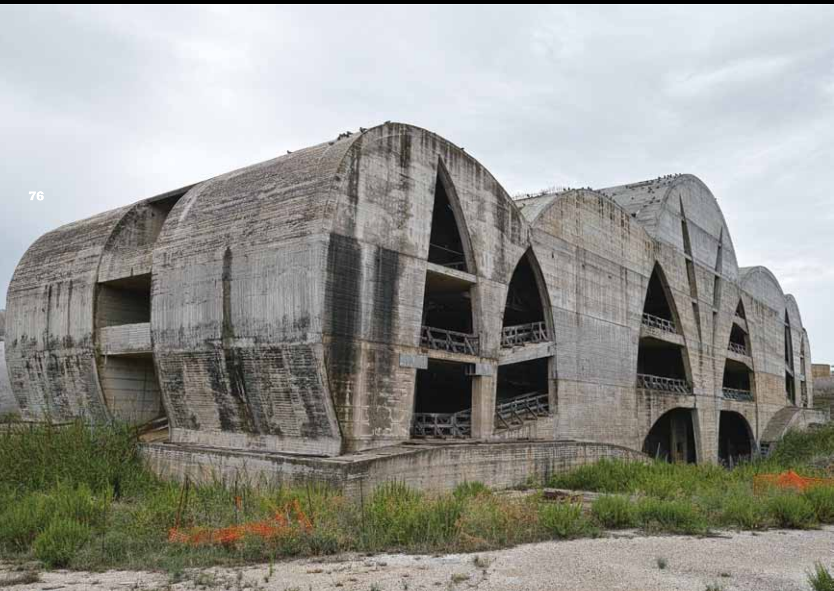
Юрий Пальмин Днибеллина-Нуова. Фронтальный театр, Пьетро Консагра, с 1984 (не завершён) 2018 Фотография, размеры варьируются.