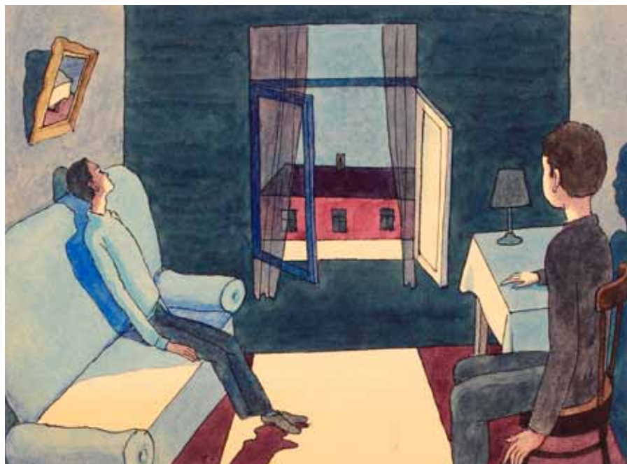
Виктор Пивоваров. Ночной разговор. Из альбома «Действующие лица». 1996. © Виктор Пивоваров