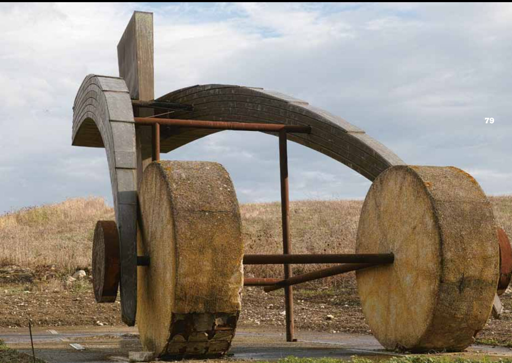
Джибеллина-Нуова. Пахарь, Орнальдо Помодоро, 1986 2018

Фотография, размеры варьируются.