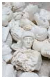
На обложке: Клаудио Пармиджани Без названия 2013—2015

При поддержке Федерального агентства по печати и массовым коммуникациям